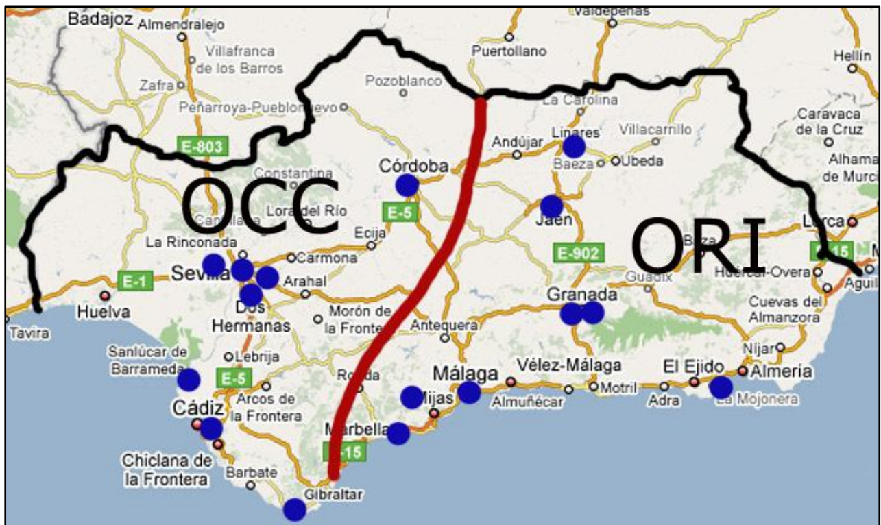
MAPA DE EQUIPOS DE DIVISIÓN DE HONOR